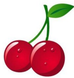
Peach and cherry,