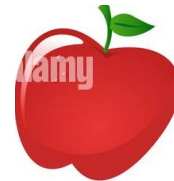
Lemon and apple,