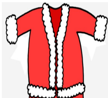
a red coat