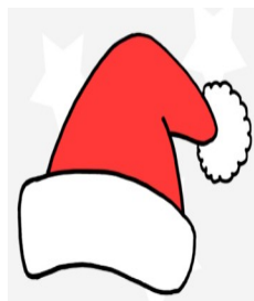
a red hat

What Santa is wearing? W co ubrany jest Mikołaj?