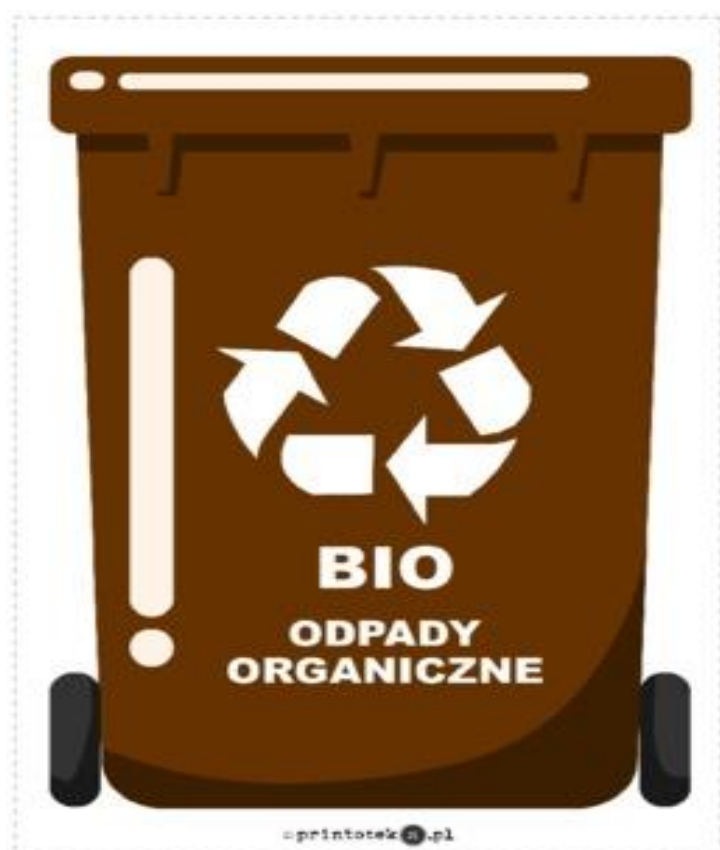
Załącznik nr 1