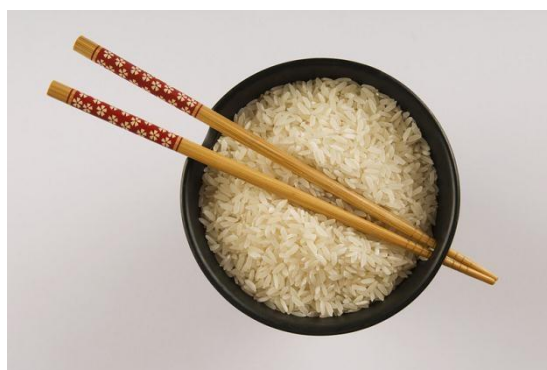
TRADYCYJNA POTRAWA CHIŃSKA